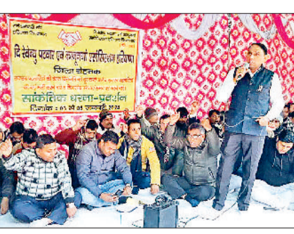
रोहतक। अपनी मांगों के लिए धरना के दौरान नारेबाजी करते हुए पटवारी-कानूनगो।

पे ग्रेड लागू करवाने और पदोन्नति परीक्षाओं का परिणाम समय से जारी करने की मांग को लेकर वीरवार को दूसरे दिन भी जिले के पटवारी और कानूनगो हड़ताल पर रहे। रोहतक तहसील कार्यालय के बारे कर्मचारियों ने सरकार के खिलाफ नारेबाजी की। हड़ताल की वजह से राजस्व विभाग के कार्य प्रभावित हुए। 5 जनवरी शुरुवार पूर्व निर्धारित आंदोलन का अंतिम दिन है। इसके बाद मांगों को लेकर कर्मचारी भविष्य की क्या रणनीति बनाएंगे, इसका निर्णय शुरुवार शाम को