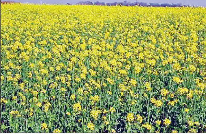
रोहतक। भिवानी रोड स्थित खेतों में ऐसे खिल रही सरसों की फसल।

सरसों की लहलहाती फसल दे रही बसंत का संदेश